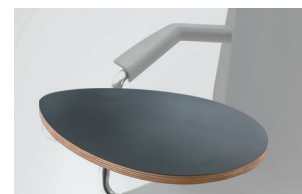
armrest + multilayer tablet bracciolo + tavoletta multistrato