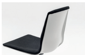
front upholstered shell scocca frontale imbottita