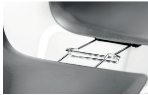
alignment links agganci allineamento