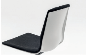
front upholstered shell scocca frontale imbottita