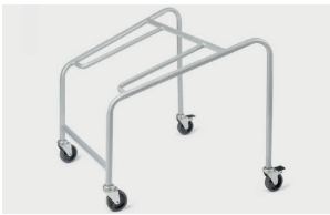
trolley (max 20 pcs) carrello