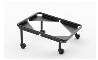
trolley (max 10 pcs) carrello