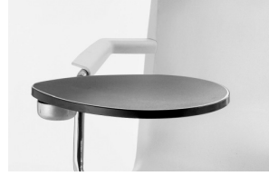
armrest + ABS tablet bracciolo + tavoletta ABS