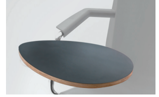
armrest + multilayer tablet bracciolo + tavoletta multistrato