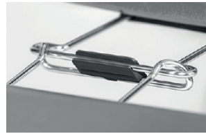
block for alignment links blocco agganci